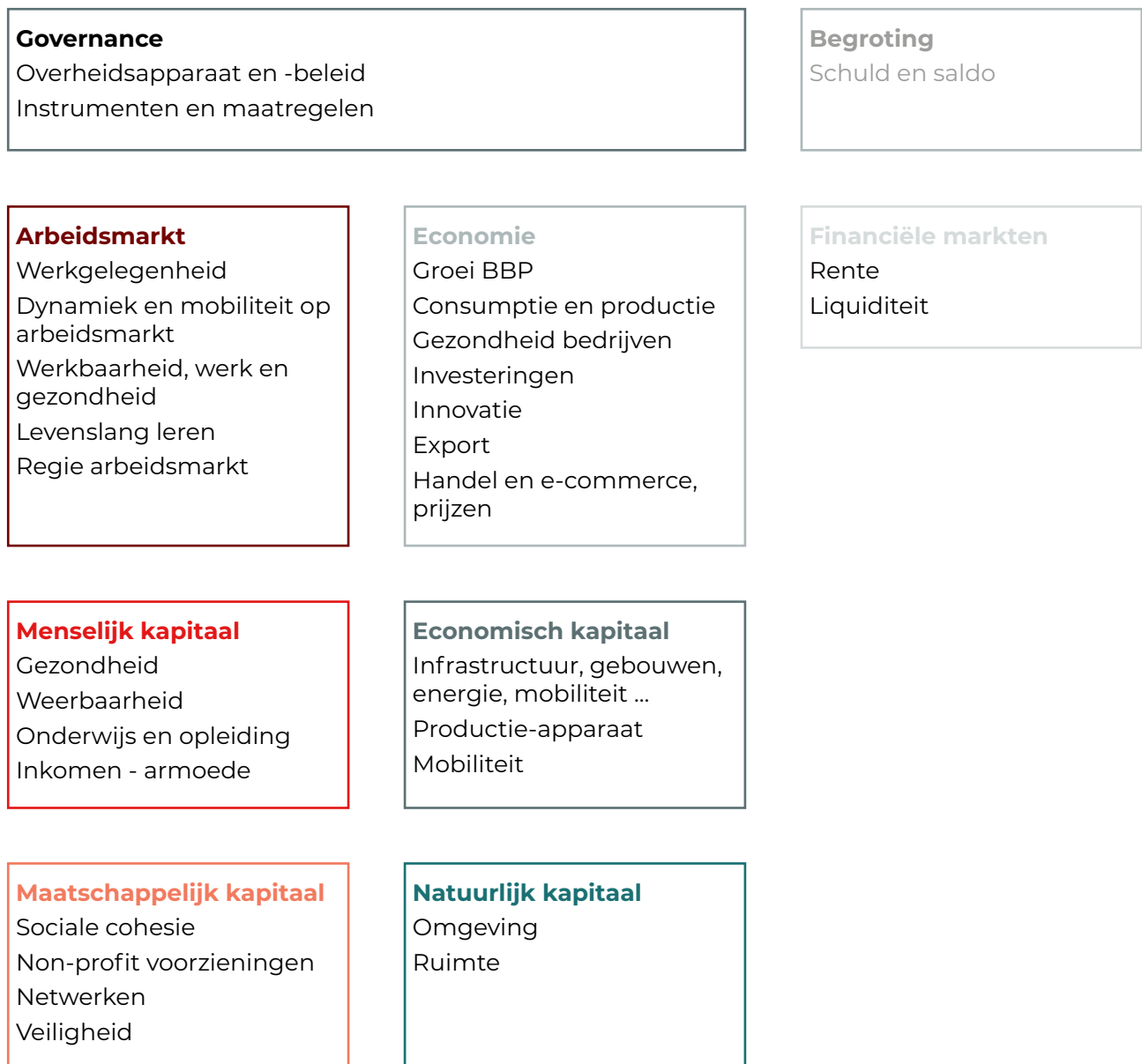
Figuur 1: Coronabeleid vergt brede, systemische aanpak